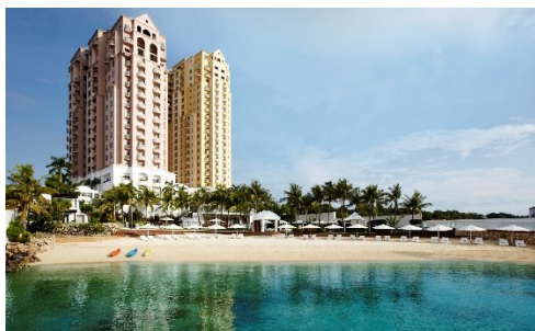
▲ モーベンピックホテル外観

モーベンピックホテル マクタン アイランドセブですが、8/31より無期限の営業停止にはいるとホテルより連絡がありました。ホテル自体は営業停止になりますが、ホテル内レストランのイビザビーチクラブに関しては、引き続き営業をすることです。ホテルとしては、外国人の受け入れが再開になった場合、お客様をお迎えできるように準備を整えるとのこと。