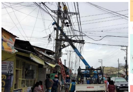
△電柱・電線の修理も徐々に進んできている

ライフラインについてはセブ・マクタン島共に一部の地域で電力が復旧し始めているが、インターネットなどについては依然として広範囲のエリアで繋がらない状況。一部の自治体では警官配備の元で食料の配給などが行われており、多くの住民が集まって来ている。また、住民1家族につき5000ペソ(約12,000円)を配るという案も検討されている。