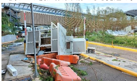
△台風通過直後のセブ・マクタン空港(セブ支店)

ライフラインについてはセブ・マクタン島共に一部の地域で電力が復旧し始めているが、インターネットなどについては依然として広範囲のエリアで繋がらない状況。一部の自治体では警官配備の元で食料の配給などが行われており、多くの住民が集まって来ている。また、住民1家族につき5000ペソ(約12,000円)を配るという案も検討されている。