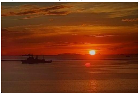
△真っ赤に燃え上がる様なマニラ湾の夕日

マニラ湾の夕日は海と空が赤く燃え上がるような迫力があり、夕暮れ時になると現地住民達もよく湾岸に集まってきている。